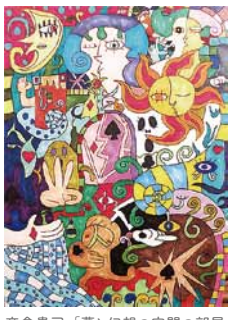
高倉貴司「夢と幻想の空間の部屋」