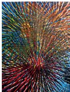
浅井栄二「花火大会」